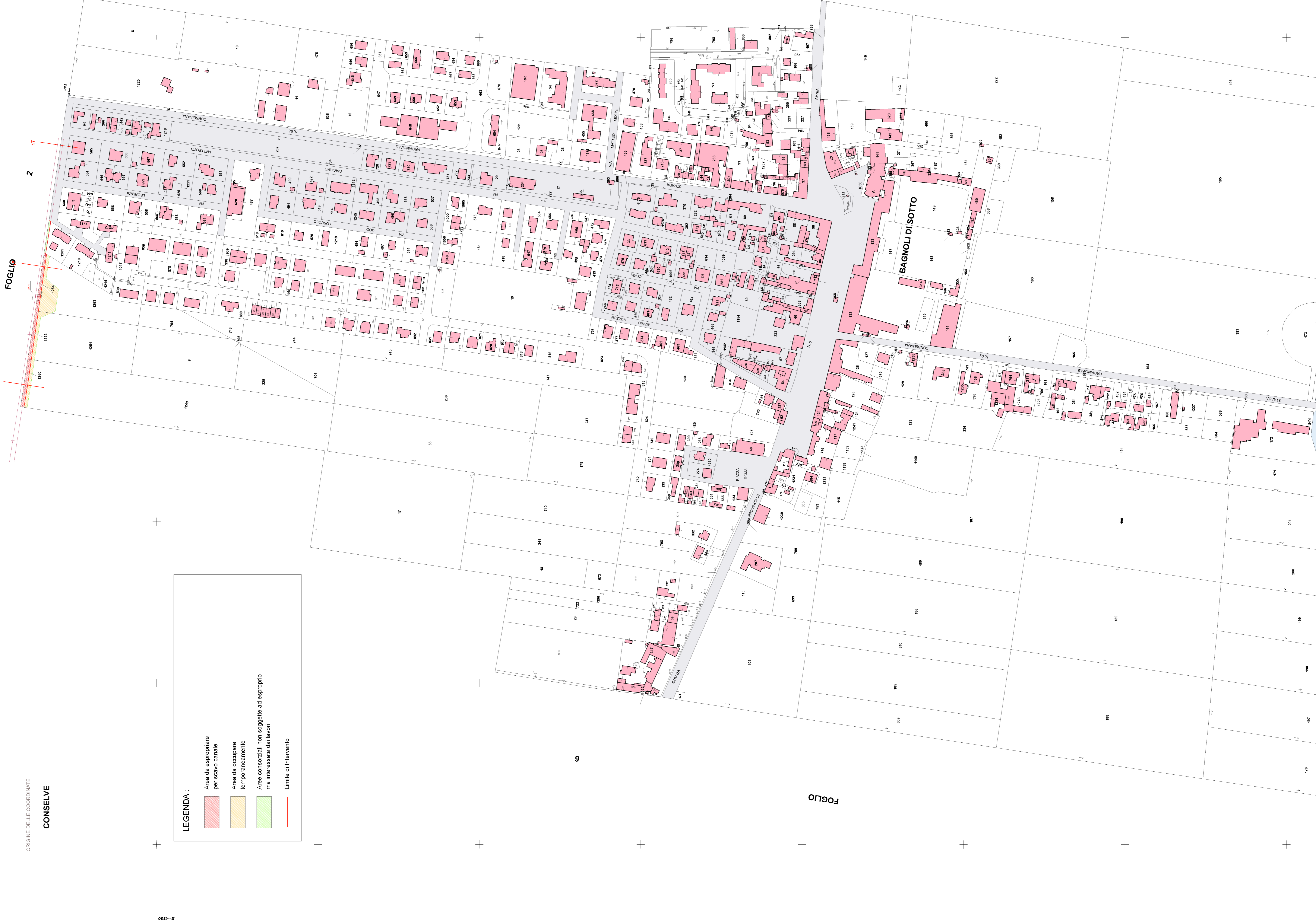
PLANIMETRIA DI INQUADRAMENTO - scala 1:20000